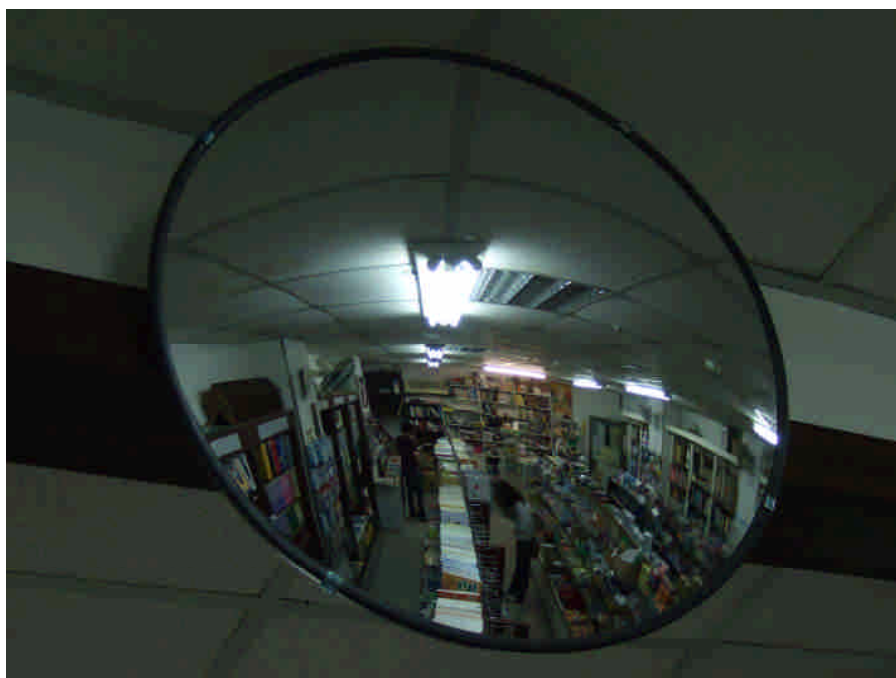
圖 2-1 從後照鏡看書苑

「還有一個畢業生，有時候會跟我聊天，竟然偷了一『套』考研究所的書，還分兩次偷。我真是太笨了，第一次過後我看他來就觀察他，後來去倉庫取書，他就拿走了。哎啊！氣死我了。」